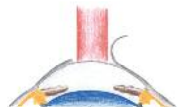
Der Laser verdampft mit jedem Laserimpuls die Hornhaut nach genauen Vorberechnungen ab.