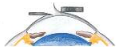
Die gebildete Lamelle wird auf die Seite geschoben.